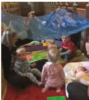
Babysalmesangsafslutning og kravlegudstjeneste med hele familien i Nørup Kirke maj 2017.

Alle er velkomne uanset kendskab til kirken. Undervisningen er gratis, men det er en god idé at tilmelde sig.