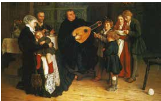
Maleri af Gustav Spangenberg 1875. Luther elskede familielivet. Nød "en ren, god, almindelig hverdagsmad". Sang og spillede gerne på sin lut.