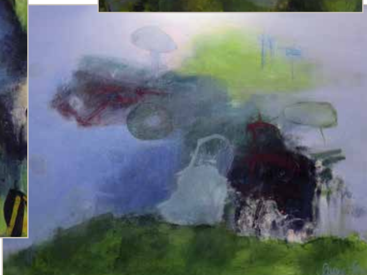
Malerier fra Sanne Sørensens ophængning i Randbøl Sognestue.