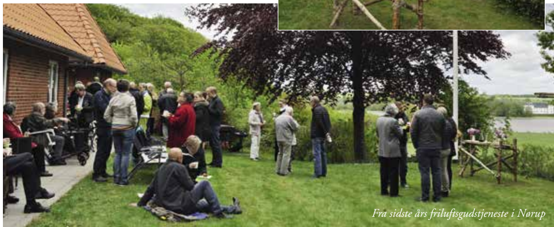
Fra sidste års friluftsgudstjeneste i Nørup