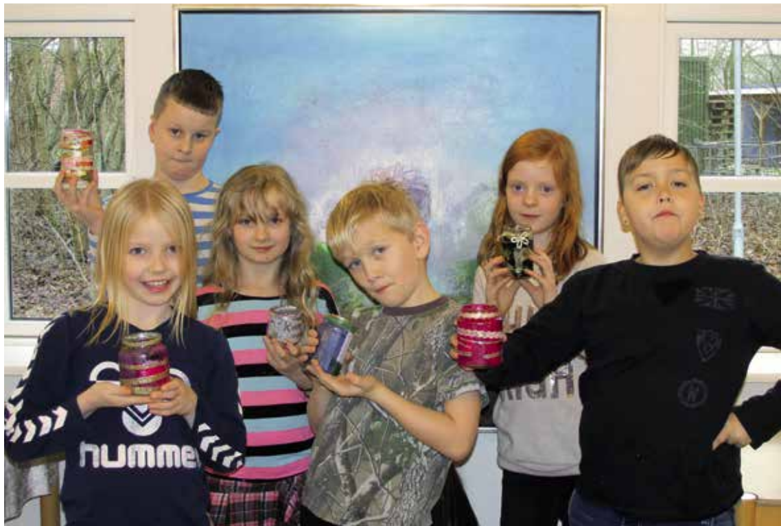
MINIKONFIRMANDERNE FRA RANDBØL MED HJEMMELAVEDE INDSAMLINGSGLAS