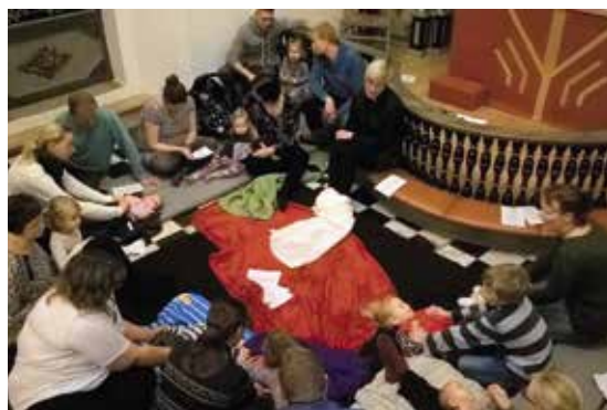
Fra gudstjenesten i Nørup, december 2015.

Kirke den 2. marts, og senest mandag den 16. maj til gudstjenesten i Nørup Kirke den 18. maj.